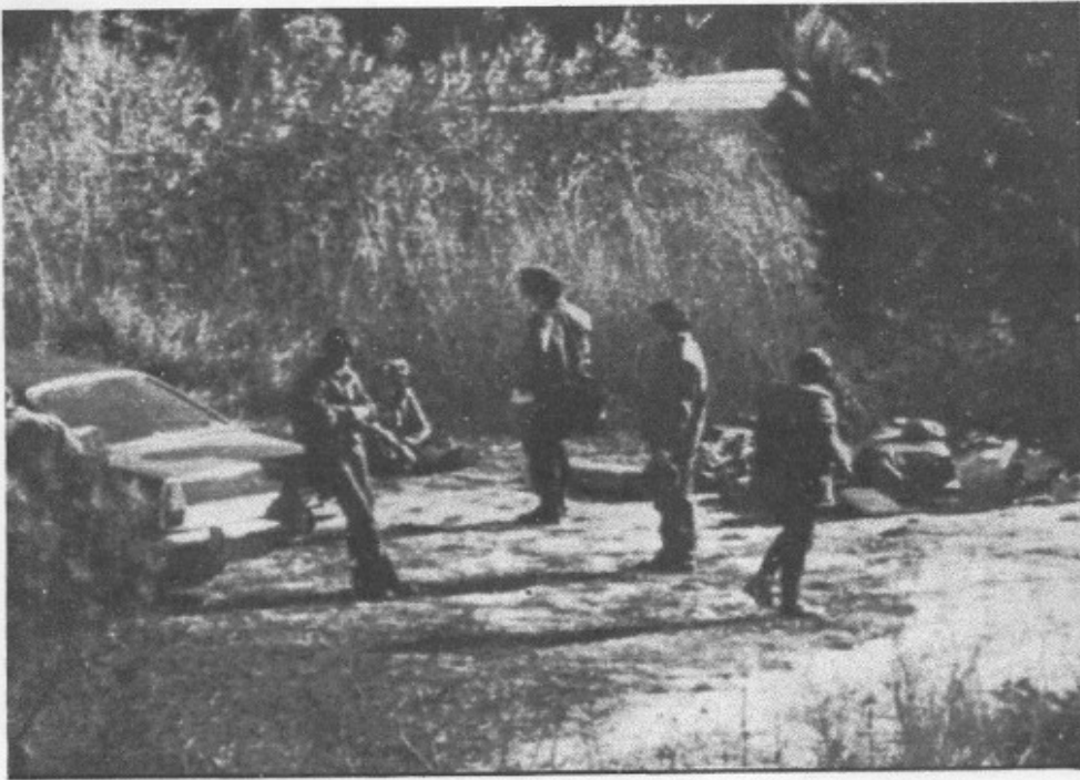
Preparándose para el regreso. Los jóvenes "guerreros" parecen comentar las incidencias de la jornada.

rojo. Más adelante hallamos, pintado en una roca, el signo de la victoria de la heráldica franquista. En la pared que protege la Cova Negra—30.000 años de historia les contemplaban— los "jóvenes guerreros" habían pintado las siglas "A. A. A." (Alianza Apostólica Anticomunista). La catedral de la civilización valenciana violada. A la altura de este lugar ya empezamos a oír el sonido de las explosiones y detonaciones.