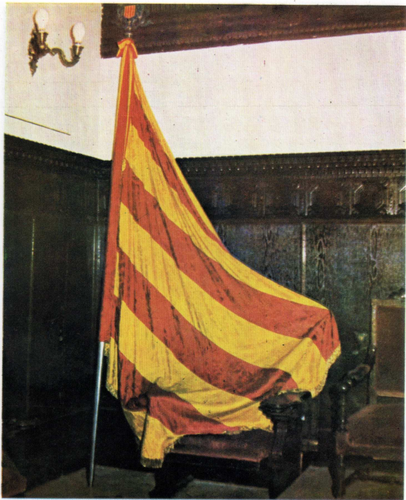
Bandera de Morvedre. Morvedre, l'actual Sagunt, com a "vila reial" que era —i igual que totes les ciutats, les viles i els llocs no feudals— tenia per senyera pròpia la de les quatre barres sense blau. És una de les poques que han arribat fins avui, possiblement en una refecció o restauració del segle XVI o del XVII. Es conserva a les dependències de l'Ajuntament de Sagunt