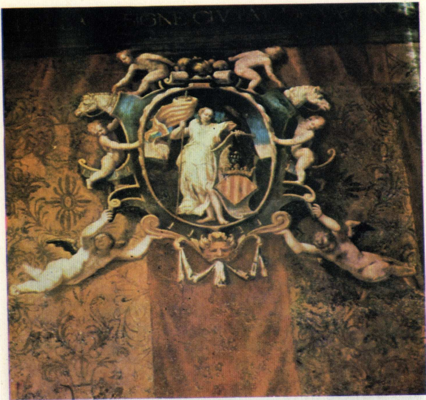
(Dalt). — Palau de la Generalitat, a València. Fragment de pintura mural de l'anomenat Saló de Corts, que representa l'emblema del Braç Reial: un àngel que sosté l'escut i la bandera de les poblacions valencianes que el constituïen. La senyera és la de les quatre barres, sense discussió: sense blau

(Darrere). — Palau de la Generalitat, a València. També un fragment de mural del Saló de Corts. La bandera en mans de l'àngel és encara més explícita. València —la ciutat-capital, que tenia la seua bandera específica amb el blau— no va fer cap objecció, com es veu, a la representació genèrica de les quatre barres a seques: reconeixia explícitament que, per al poble valencià no feudalitzat, la bandera única i inequívoca era la que havia de ser: la de les barres solitàries. Malgrat la seua propensió centralista, les autoritats de València, en l'època foral, no gosaren imposar el blau municipal a les altres poblacions "lliures" del país. De fet, València reconeixia com a bandera de tots els valencians la de les quatre barres, i es reservava per a ella, en tant que municipi, el privilegi del blau coronat