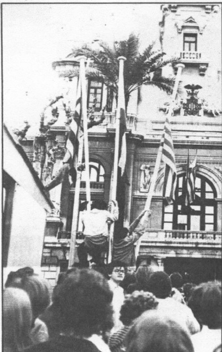
La Senyera no duró mucho.

La presencia de "camisas azules" de Fuerza Nueva y de los "camisas negras" con los guantes bien calados —y no precisamente por el frío...— hacían presagiar que algo se estaba cocinando en el recinto. Una representación de los libreros acudió a Gobierno Civil para denunciar los hechos y reclamar la protección de la fuerza pública. "El gobernador lo cortó de raíz —comenta un librero—.